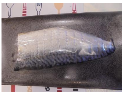
人気好評のサバのフィレ干物