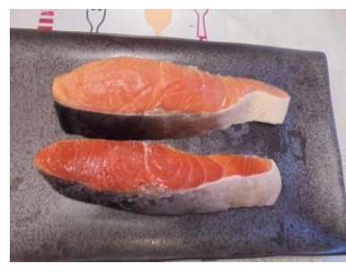
得意なシャケ切身も当社製品 KF-2000 で水分調整済み