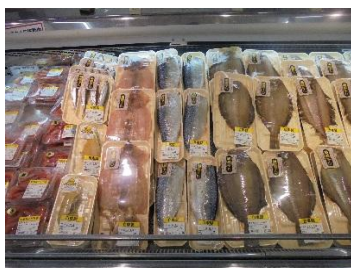
いずれもトレイパック で販売