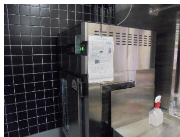
作業場に設置の GSK 製 KF-1000