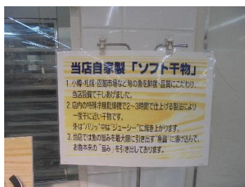
POP でソフト干物を紹介