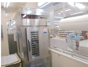
売場からもよく見える KF-1000