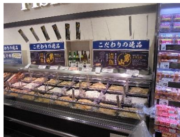
自家製漬魚コーナー