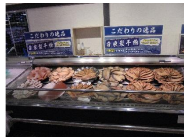
自家製干物コーナー