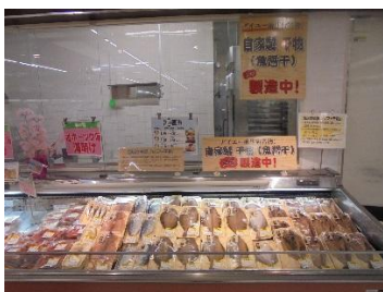
作業場に KF-1000 設置

札幌駅 地下鉄 → 麻生駅で下車 大型スーパーマーケットに立ち寄る。 現在、鮮魚部では店内の干物加工品が大人気になっており、 当社の KF-1000 は、売場からよく見える作業場に設置。