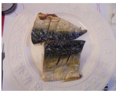
調理後のサバ (絶妙なおいしさで大人気！)