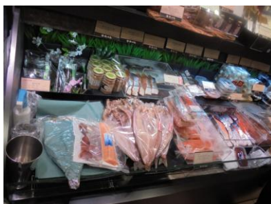
中央は、ホッケの一夜干し